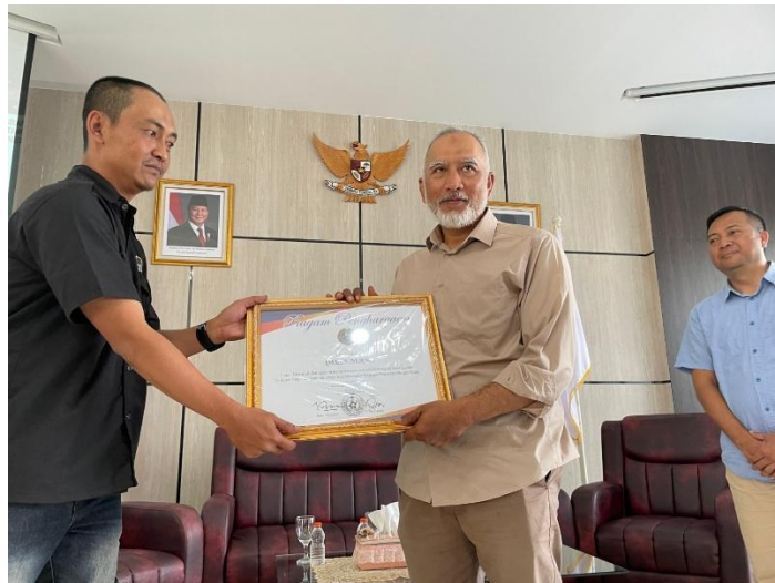
dok. JWI Kota Cimahi

Ada lima prinsip yang harus diketahui dan dipegang masyarakat untuk meminimalisasi penyimpangan saat menghadapi wartawan: 1). Verifikasi kepentingan: Masyarakat harus menanyakan kepentingan tamu yang mengaku wartawan. Jika tidak berkaitan dengan tugas jurnalistik, mereka berhak menolak. 2). Batasan layanan: Melayani wartawan sejauh hanya untuk permintaan informasi yang sah. 3). Kebijakan "Tanpa Amplop": Membiasakan untuk tidak memberikan imbalan uang (amplop) demi menjaga independensi dan mencegah munculnya wartawan gadungan lain yang datang karena berharap imbalan serupa. 4). Pelaporan hukum: Jika terjadi pemerasan, masyarakat didorong untuk melapor kepada polisi karena tindakan tersebut merupakan ranah pidana yang tidak dilindungi UU Pers. 5). Koordinasi dengan organisasi resmi: Masyarakat perlu berkoordinasi dengan organisasi wartawan yang kompeten (seperti PWI atau AJI) untuk memverifikasi keabsahan jurnalis (Hidayat & Abdullah, 2015).