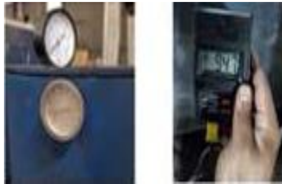
Gambar 2 Gambar Hasil Penelitian

Berdasarkan gambar tersebut indikator pengujian telah sesuai, baik dalam temperatur maupun suhu yang digunakan dalam proses pengujian tersebut. Ini juga menunjukkan bahwa masa uap jenuh dapat menghilangkan panas sehingga distribusi panas yang dialirkan melalui pipa sesuai dengan proses yang dibutuhkan.