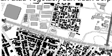
Gambar 3. Segmen 2 Koridor Jalan Prof. Soedarto