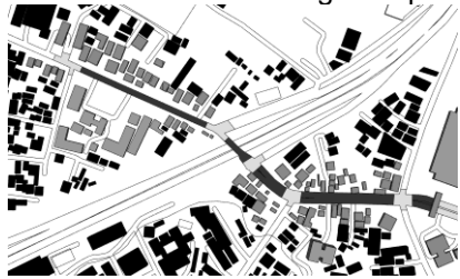
Gambar 2. Segmen 1 Koridor Jalan Prof. Soedarto