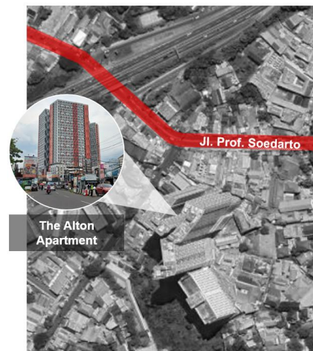
Gambar 4. The Alton Apartment (Segmen 1)

Eksistensi koridor jalan Prof. Soedarto sebagai gerbang Undip Tembalang berfungsi sebagai ruang bersirkulasi bagi manusia dan kendaraan, di dalamnya mengandung aspek pembentuk koridor, yaitu aspek visual. Sepanjang koridor jalan Prof. Soedarto terdapat beberapa obyek yang memiliki dominasi terhadap area sekitarnya, antara lain The Alton Apartment di Segmen 1 (Gambar 4), Gerbang Undip dan Muladi Dome di Segmen 2 (Gambar 5), serta Bundaran Universitas Diponegoro di Segmen 3 (Gambar 6).