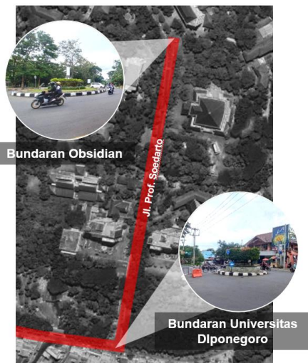
Gambar 6. Bundaran Undip dan Bundaran Universitas Diponegoro (Segmen 3)