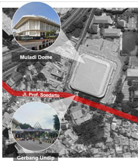
Gambar 5. Gerbang Undip dan Muladi Dome (Segmen 2)