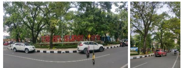
Gambar 2. Lokasi Taman Superhero (K1)

Lokasi Taman Superhero yang berada di Jalan Anggrek dan Jalan Bengawan berhasil memanfaatkan tapak berbentuk segitiga yang berada di persimpangan jalan. Meskipun berada di kawasan perkotaan, jalan yang berada di sekitar taman ini memiliki intensitas kendaraan rendah sehingga meminimalisir terjadinya kecelakaan bagi anak-anak. Selain itu lokasi Taman Superhero secara fisik terlindungi dengan pagar (perdu dan semak-semak) yang tidak mudah dipanjat oleh anak-anak (Gambar 2).