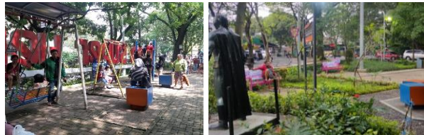
Gambar 8. Material Bahan Taman Superhero (K2)

Material yang digunakan pada alat permainan didominasi besi yang tidak berbahaya bagi anak namun perlu perawatan jangka Panjang untuk menghindari efek perkaratan sehingga tidak mudah mengelupas (Gambar 8).