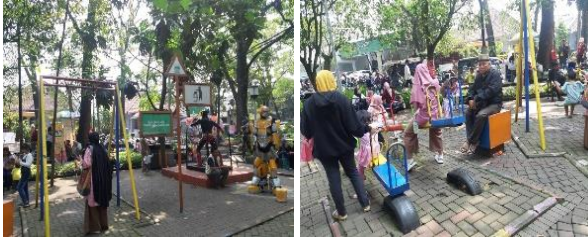
Gambar 4. Peralatan Permainan Taman Superhero (K1) Konstruksi

meminimalkan benturan saat anak terjatuh seperti pasir ataupun karet. Peralatan permainan tidak mempunyai sudut tajam yang dapat membahayakan pengunjung terutama anak-anak.