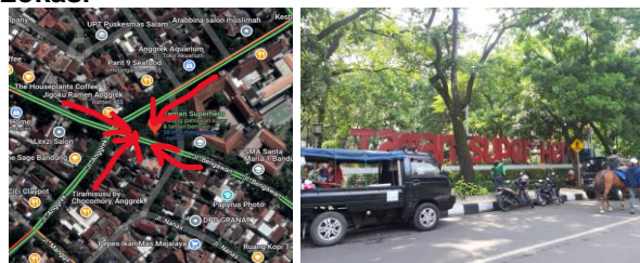
Gambar 13. Lokasi Taman Superhero (K4)

Taman Superhero mudah dijangkau oleh masyarakat Kota Bandung karena lokasinya yang berada di pusat kota (Gambar 13). Sistem informasi menuju lokasi dan gerbang Taman Superhero mudah terlihat dan dikenali dari berbagai sisi. Taman ini dengan mudah dapat diakses oleh anak-anak dari semua latar belakang tanpa terkecuali.