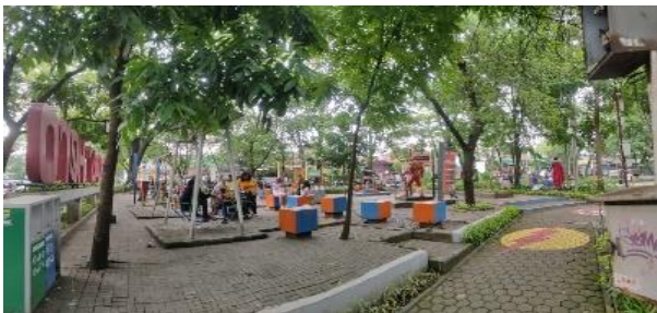
Gambar 18. Peralatan Permainan (K6)

Peralatan permainan mempunyai bentuk yang mampu mengeksplorasi daya imajinasi anak-anak dengan wujud superhero . Peralatan permainan juga menyesuaikan warna pelangi yang identik dengan keceriaan (Gambar 16).