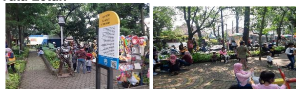
Gambar 10. Tata Letak Taman Superhero (K3)