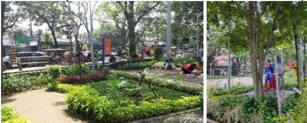
Gambar 17. Tata lansekap Taman Superhero (K6) Peralatan Permainan

Penataan vegetasi yang cantik pada beberapa sudut area mampu membuat taman ini lebih menarik bukan hanya bagi anak-anak tapi juga orang tuanya. Kombinasi yang baik dalam tata landscape membuat pengunjung taman bermain dapat menikmati pemandangan yang indah di dalam maupun di luar kawasan taman (Gambar 17).