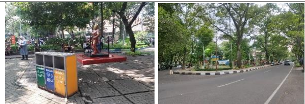
Gambar 7. Lokasi Taman Superhero (K2)

Lokasi Taman Superhero tidak berada pada area dengan tingkat gangguan kesehatan yang tinggi terutama polusi udara, dan penciuman (bau) yang dapat mempengaruhi aktivitas bermain anak. Kawasan dipenuhi pepohonan yang rindang agar terkesan lebih asri walaupun berada di pusat kota.