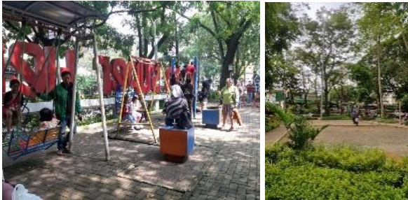
Gambar 12. Material Bahan Taman Superhero (K3)

Pada area dengan intensitas penyinaran matahari tinggi tidak terdapat bahan yang mudah menghantarkan panas serta bahan berdaya tahan tinggi dan mudah pemeliharaannya (Gambar 12).