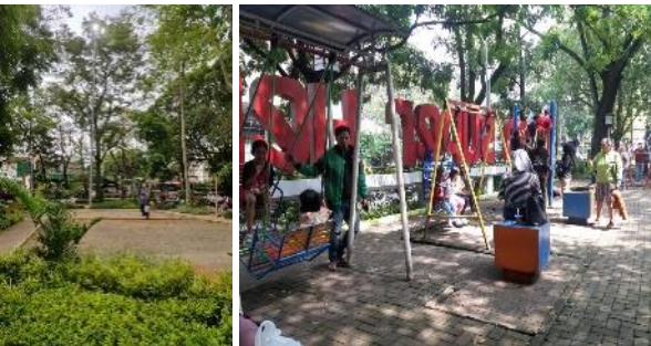
Gambar 6. Material di Taman Superhero (K1)

Bahan pijakan di zona permainan belum mampu meminimalkan terjadinya slip saat anak-anak melakukan kegiatan bermain karena bermaterial paving. Sedangkan zona lapangan hanya dilengkapi oleh pasir yang memungkinkan akan terjadi slip (Gambar 6).