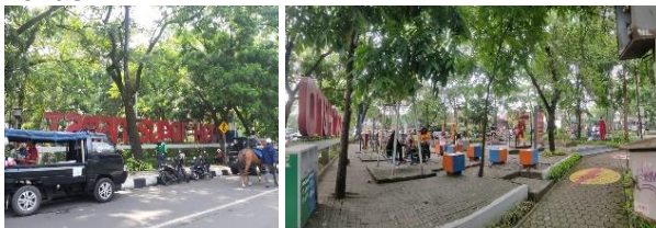
Gambar 9. Lokasi Taman Superhero (K3)

Taman Superhero tidak mengganggu aktivitas yang terjadi di luar kawasan karena berada di persimpangan jalan intensitas kemacetan rendah dan bukan di area permukiman padat.