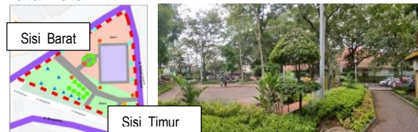
Gambar 3. Tata Letak Taman Superhero (K1)

Tata letak Taman Superhero sudah didasari zonasi aktivitas bermain aktif-pasif dan jenis permainan. Seperti area barat untuk zona bermain yang dilengkapi peralatan permainan dan area timur zona bermain yang dilengkapi lapangan terbuka. Pemisahan diterapkan dengan media vegetasi, ini diperlukan untuk memastikan tidak saling terganggunya antar kegiatan bermain (Gambar 3). Peletakan fasilitas permainan sudah memperhatikan ruang gerak anak-anak, untuk meminimalkan terjadi benturan antar pengunjung maupun pengunjung dengan peralatan permainan yang bergerak (ayunan, jungkat-jungkit dan lainnya).