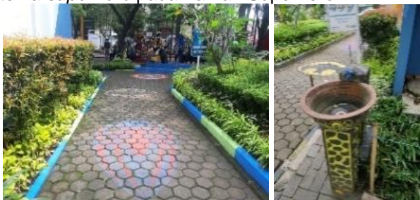
Gambar 19. Konstruksi jalur pedestrian (K6)

Desain struktur telah dipertimbangkan sehingga tercipta kesatuan estetika dengan fasilitas taman lainnya serta lingkungan wilayah sekitar. Beberapa ikon superhero muncul dalam permukaan konstruksi paving (Gambar 19), yang memperkuat tema superhero pada Taman Superhero.