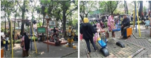
Gambar 11. Peralatan Permainan (K3)

Desain peralatan permainan sederhana dan sesuai standar, dimaksudkan untuk kenyamanan bagi anak-anak saat bermain dan kemudahan pemeliharaan bagi pengelola (Gambar 11).