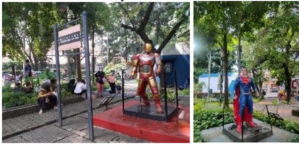
Gambar 16. Penerapan tema di Taman Superhero (K6) Tata Letak

Di dalam area taman, penerapan tema superhero lokal ataupun mancanegara mampu membuat anak-anak merasa nyaman secara visual.