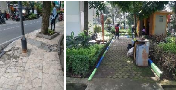
Gambar 5. Konstruksi jalur pedestrian (K1)

Kekuatan bahan konstruksi seperti di jalur pedestrian Taman Superhero terlihat ada sedikit kerusakan pada permukaan keramik di beberapa titik. Sedangkan di area dalam kawasan didominasi perkerasan paving yang masih baik dan terawat (Gambar 5).