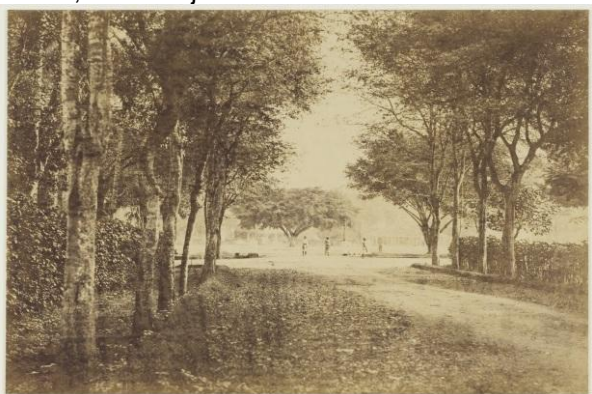
Gambar 2 Alun-alun Kota Tahun 1880

Alun-Alun Kota Blitar merupakan ruang terbuka yang fungsi utamanya sebagai tempat berkumpulnya masyarakat serta pejabat baik itu sebagai tempat diadakannya kegiatan resmi maupun rekreasi termasuk rampogan macan yang merupakan tradisi masyarakat Jawa pada masa tersebut. Berdasarkan peta tahun 1890 tersebut dapat dilihat terdapat bangunan penting seperti pendopo di sebelah utara, penjara di sebelah timur, perkantoran di sebelah selatan, dan masjid di sebelah barat.