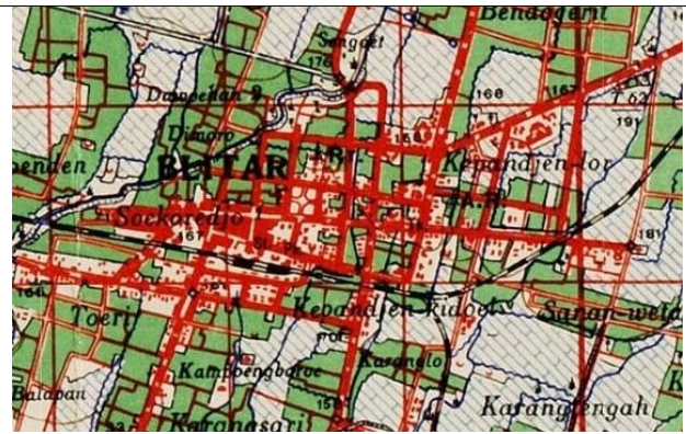
Gambar 8 Peta Tahun 1945