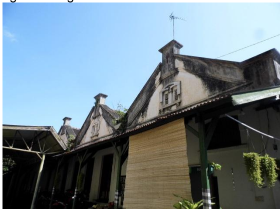
Gambar 9 Bangunan Kolonial di selatan Pegadaian. (Dokumentasi Tim Riset Arkeologi Blitar 2023, Universitas Udayana)

Bangunan pendukung yang terlihat pada peta tahun 1890 hanya dua bangunan yang merupakan bangunan pendukung di bidang industri/perkebunan, dua bangunan tersebut yaitu Gudang Kopi ( koffie pakhuis ) yang berada di timur pasar dan Gudang Garam ( zout pakhuis ) di sebelah selatan area pasar/penjara. Kedua bangunan tersebut sudah tidak tercatat secara spesifik lagi pada peta tahun 1939 dan 1945, akan tetapi berdasarkan analisis peta tahun 2023, dapat diketahui bahwa kedua bangunan tersebut telah tiada wujudnya. Kemungkinan besar untuk bangunan Gudang Garam beralih fungsi menjadi pegadaian pada awal abad ke XX, karena pada tahun 2023 menunjukkan Pegadaian Kota Blitar memiliki titik yang sama dengan bangunan Gudang Garam yang ada pada tahun 1980, serta terdapat bangunan kolonial yang dapat dibilang masih utuh meski terdapat beberapa tambahan, bangunan tersebut berada di selatan bangunan Pegadaian.