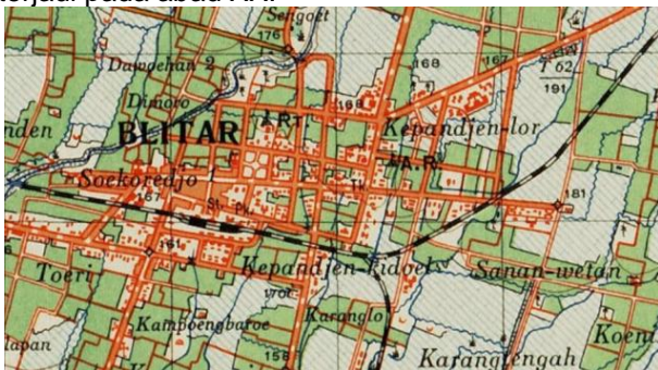
Gambar 7 Peta Tahun 1939 (KITLV, Leiden University Library)

Perkembangan tata kota yang terjadi pada abad XX mengalami perkembangan cukup signifikan dibandingkan dengan peta sebelumnya pada tahun 1890. Berikut peta tahun 1939 dan peta tahun 1945, serta penjelasan mengenai perkembangan yang terjadi pada abad XX.