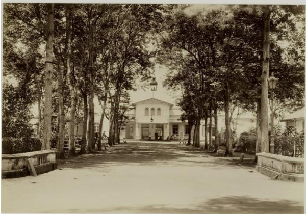
Gambar 6 Stasiun Blitar Dibangun Tahun 1884

Stasiun Blitar menjadi salah satu pusat distribusi penting di wilayah Keresidenan Kediri. Jalur kereta api yang menghubungkan Blitar dengan wilayah lain memudahkan pengangkutan barang dan penumpang, serta mendukung kegiatan ekonomi dan perdagangan di kawasan tersebut. Stasiun Kota Blitar terletak di selatan Bangunan Arendsnest , bangunan stasiun dibangun pada tahun 1884.