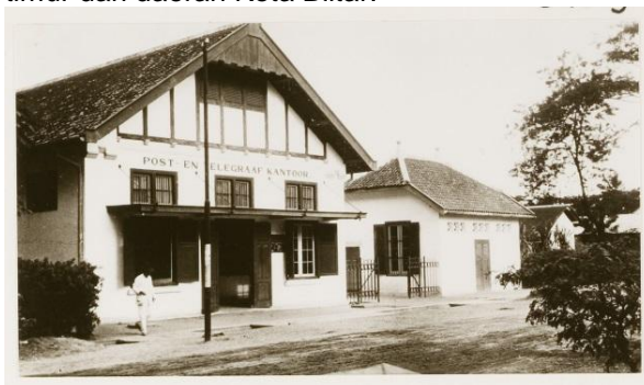
Gambar 5 Kantor Pos Tahun 1930

Bangunan Kantor Pos berada pada daerah Sanan Wetan, yang merupakan jalan kecil dari jalan raya, serta di sebelah barat dari daerah Gebang. Bangunan ini merupakan salah satu bangunan penting yang disebut dalam peta tahun 1890 dan merupakan bangunan yang berada paling ujung timur dari daerah Kota Blitar.