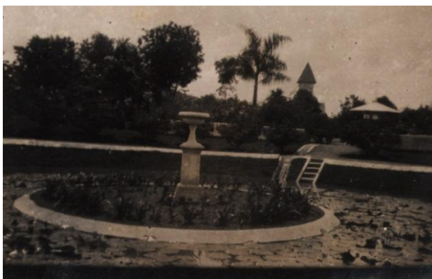
Gambar 3 Kebon Rodjo Tahun 1920 (KITLV, Leiden University Library)

Kebon Rojo merupakan taman kota yang difungsikan sebagai ruang hijau kota serta tempat rekreasi bagi warga Belanda yang bermukim di Blitar. Kebon rojo seperti namanya memiliki tanaman-tanaman yang dirawat dengan baik dan memiliki fasilitas seperti gazebo (koepel), kolam air mancur, dan kolam ikan.