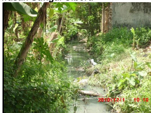
Gambar 3. Kondisi Sungai Ciberu Sebelum di bangun

Kawasan rawan bencana adalah kawasan yang sering atau berpotensi tinggi mengalami bencana alam. Kawasan rawan bencana di Desa Ciledug adalah kawasan yang sering tergenang banjir di sekitar saluran Cibeuru yang berada di wilayah RW 03 dan 04 dan wilayah RW 02. Kondisi banjir terjadi karena saluran tersebut mengalami penyempitan dan pendangkalan akibat dari perilaku masyarakat yang membuang sampah sembarangan ke