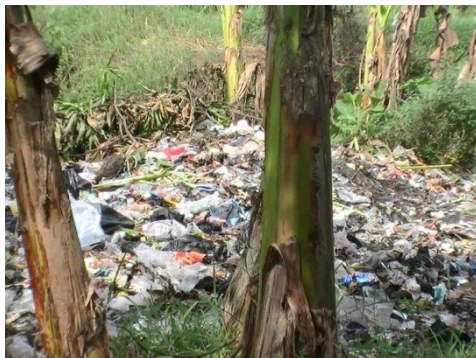
Gambar 6. Kondisi persampahan di Lingkungan Sungai Ciberu