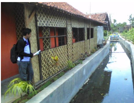
Gambar 7 Kondisi Lingkungan Sungai Ciberu setelah terbangun (sumber dok pribadi)