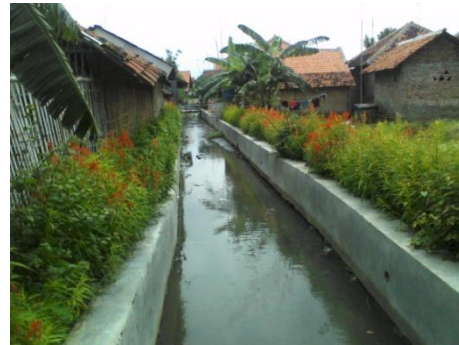
Gambar 8 Landscape Lingkungan Sungai Ciberu setelah terbangun