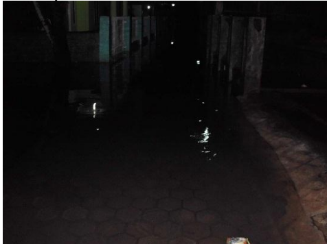
Gambar 4. Kondisi Jalan Lingkungan Sungai Ciberu saat hujan

sungai Ciberu. Hal ini menyebabkan terjadinya banjir . Apabila terjadi hujan besar saluran tersebut tidak bisa menampung air dari limpasan saluran drainase permukiman.