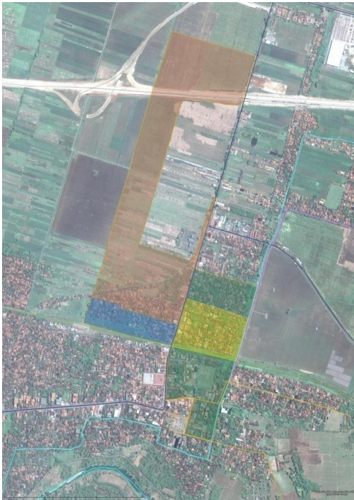
Gambar 2. Foto Udara kondisi Geografis Desa Ciledug Tengah.