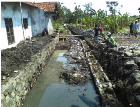
Gambar 6 Kondisi Lingkungan Sungai Ciberu saat dibangun

Sedangkan untuk tingkat keberhasilan perilaku dalam kurun waktu 2 tahun setelah pelaksanaan hasil yang diperoleh adalah menyebutkan sangat bermanfaat baik bagi warga desa maupun khususnya bagi warga kawasan sungai Ciberu. Hal ini terlihat dari kebermanfaatannya terhadap lingkungan di antaranya: (1) tidak membuang sampah ke sungai; (2) tidak membuang hajat ke sungai; (3) menata rumahnya selaras dengan lingkungan sungai; dan (4) menata lanskap di tepi sungai.