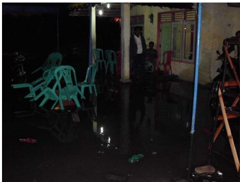
Gambar 5 Kondisi salah satu Rumah di Lingkungan Sungai Ciberu saat hujan