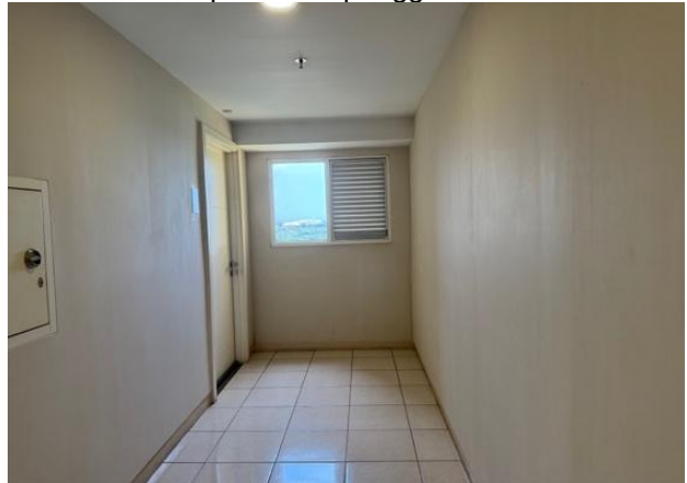
Gambar 6. Foto lampu 2

Gambar diatas menunjukkan meskipun terdapat sistem pencahayaan di beberapa titik lokasi apartemen namun berdasarkan hasil temuan lapangan dan analisa, masih terdapat keterbatasan visibilitas yang terjadi pada lokasi unit apartemen yang mengindikasikan bahwa penghuni belum memiliki jangkauan kontrol visual yang cukup luas terhadap lingkungan apartemen sebagai tempat huniannya, kondisi tersebut berpengaruh pada efektivitas natural surveillance sangat dipengaruhi luas dan kualitas keterlihatan ruang yang dapat diawasi secara pasif oleh pengguna.