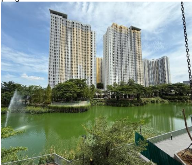
Gambar 1. Foto danau buatan & pagar hijau

Territoriality yang paling mudah dikenali di studi kasus ini berupa gerbang utama untuk keluar masuk Kawasan, serta pos satpam yang terletak di samping gerbang utama juga memberikan batas antara bagian luar dan bagian dalam apartemen. Danau buatan serta pagar hijau juga menjadi batasan fisik yang membentuk suatu territoriality yang jelas. Dari perspektif psikologi arsitektur, batas yang terbaca dengan jelas mampu memberikan sinyal psikologis kepada pengguna maupun orang luar mengenai adanya kontrol terhadap ruang tersebut. Hal ini berpotensi menurunkan peluang terjadinya aktivitas yang tidak diinginkan. Namun demikian, tingkat efektivitas territoriality pada kawasan ini masih bergantung pada konsistensi pengelolaan dan pengawasan.