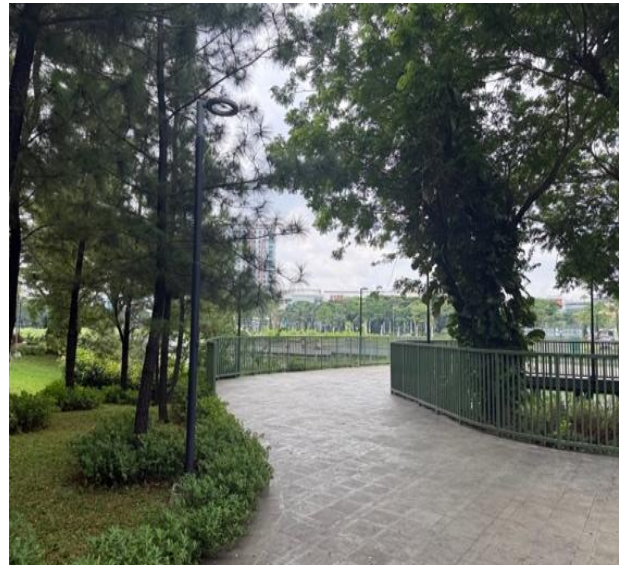
Gambar 2. Foto danau buatan & pagar hijau

Gambar 1. Menunjukkan bahwa danau buatan dan pagar hijau merupakan elemen yang membentuk suatu territoriality apartemen. Secara visual dan fisik, danau dan pagar buatan berfungsi memisahkan zona antara ruang privat dan ruang publik, sehingga menciptakan batas ruang yang lebih jelas dan dapat membantu pengunjung apartemen (non penghuni) untuk lebih memahami zona yang bisa bebas diakses di area apartemen. Dalam aspek territoriality, keberadaan batasan area dalam site tersebut memberikan sinyal kontrol dan dapat memunculkan rasa aman bagi penghuni sekaligus memberikan keterbatasan kepada pihak luar bahwa area tersebut tidak bebas diakses, sehingga territoriality tidak hanya berfungsi dalam aspek fisik, tetapi juga dapat mengontrol aktifitas pengunjung dari luar.