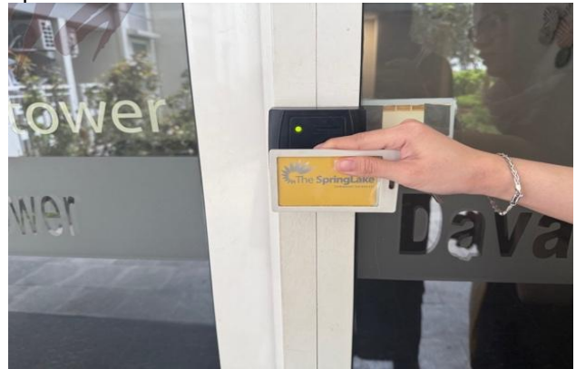
Gambar 9. Foto kartu akses

Penerapan access control pada Apartemen Springlake diwujudkan melalui penggunaan kartu akses, sistem CCTV, serta keberadaan petugas keamanan selama 24 jam. Secara umum, sistem ini menunjukkan tingkat pengendalian akses yang relatif baik dalam membatasi pergerakan pengguna ruang, khususnya pada area privat dan semi-privat, sehingga dapat meminimalkan potensi akses oleh pihak yang tidak berkepentingan masuk dalam unit apartemen.