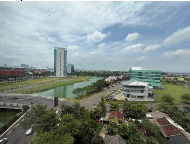
Gambar 4. Foto view sekeliling dari lantai 2

Gambar diatas menunjukkan prinsip natural surveillance pada Apartemen Springlake diimplementasikan melalui orientasi bukaan unit yang mengarah ke area luar dilengkapi dengan pencahayaan dari dalam unit gedung dan beberapa area publik. Secara teoritis, area bukaan dan tata letak jendela pada unit gedung yang mengarah ke luar unit apartemen mendukung terbentuknya pengawasan pasif oleh penghuni terhadap lingkungan sekitar, yang merupakan faktor penting untuk mengurangi adanya aktifitas yang berpotensi menuju tindakan kriminalitas.