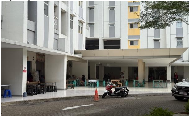
Gambar 8. Foto area komersil lingkungan sekitar summarecon (BCBD) 2

Gambar diatas menunjukkan citra lingkungan pada Apartemen Springlake pada area publik yaitu terdapat area komersil di landar dasar apartemen, Dari perspektif psikologi lingkungan, citra tersebut berkontribusi dalam meningkatkan rasa nyaman penghuni dengan kedekatan apartemen dengan fasilitas komersial yang aktif, di mana aktivitas sosial yang berlangsung secara terus-menerus di sekitar kawasan menciptakan bentuk pengawasan tidak langsung (informal surveillance). Keberadaan aktivitas ini dapat meningkatkan tingkat kewaspadaan lingkungan dan memperkecil peluang terjadinya tindakan kriminal.