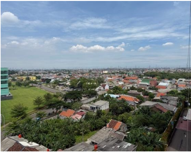
Gambar 3. Foto view sekeliling dari lantai 2 mengarah ke kondisi di luar

pandangan psikologi arsitektur, keterbatasan visibilitas ini belum memaksimalkan rasa aman karena penghuni tidak memiliki kontrol visual yang lebih luas terhadap lingkungan sekitarnya.