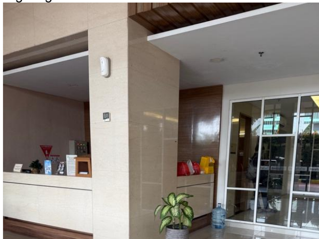
Gambar 12. Foto pos satpam dalam apartemen

Sistem access control yang diterapkan apartemen telah efektif namun diperlukan penguatan pada aspek desain arsitektural yang bersifat pasif agar tercipta keseimbangan antara kontrol mekanis dan partisipasi penghuni dalam menjaga keamanan lingkungan.