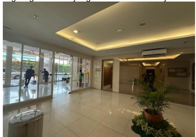
Gambar 10. Foto lobby

Penerapan acces control pada unit apartemen dapat meningkatkan sistem keamanan pada area bangunan apartemen sebagai hunian dengan privacy yang cukup tinggi, namun di sisi lain, penambahan sistem keamanan buatan pada bangunan apartemen dapat juga melemahkan peran kontrol sosial (informal control), yang seharusnya menjadi bagian penting dalam menciptakan lingkungan hunian yang aman dan berkelanjutan.