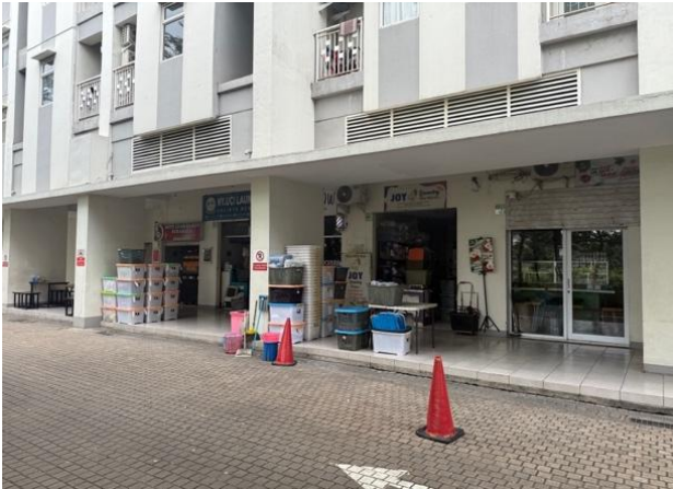
Gambar 7. Kondisi area komersil lingkungan sekitar summarecon (BCBD) 1

Namun demikian, ketergantungan pada citra pengembang menunjukkan bahwa aspek desain fisik belum sepenuhnya menjadi faktor utama dalam membangun persepsi keamanan, sehingga perlu adanya penguatan pada kualitas ruang secara arsitektural.