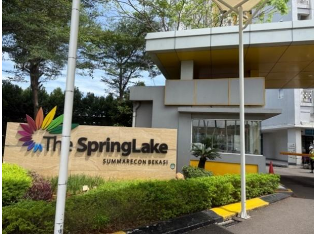
Gambar 11. Foto pos satpam 1

Kemudian posisi pos satpam apartemen sedikit menjorok dari site dan hanya ada satu pos keamanan yang dekat dengan gerbang depan sehingga kurang menjangkau ke area lain.