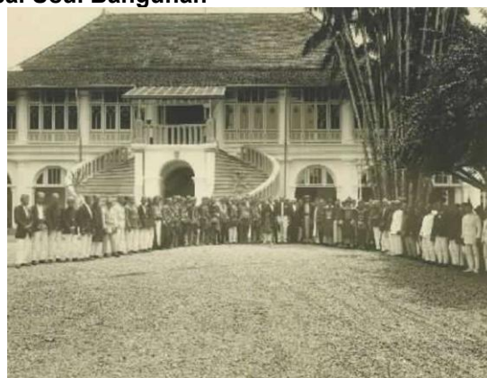
Gambar 1. Museum SMB II dahulu kala Kota Palembang dikenal sebagai “Venesia dari Timur” karena struktur ruangnya yang didominasi