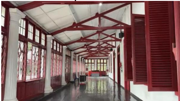
Gambar 2. Koridor lantai 2 Museum SMB II

Arsitektur Museum Sultan Mahmud Badaruddin II memperlihatkan bentuk adaptasi arsitektur kolonial terhadap iklim tropis lembap yang ditandai suhu tinggi, kelembapan tinggi, dan curah hujan tinggi. Desain bangunan kolonial di Indonesia pada dasarnya memang tidak sepenuhnya meniru arsitektur Eropa, melainkan mengalami penyesuaian terhadap kondisi lingkungan tropis (Handinoto, 1996). Hal ini terlihat melalui tata massa yang relatif terbuka dan pemanfaatan aliran angin dari Sungai Musi sebagai ventilasi alami. Bukaan berukuran besar, jendela tinggi, serta plafon yang tinggi memungkinkan terjadinya ventilasi silang dan pembuangan udara panas secara alami, suatu strategi yang umum diterapkan pada arsitektur kolonial tropis untuk menciptakan kenyamanan termal tanpa ketergantungan pada sistem pendingin mekanis.