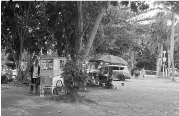
Gambar 1. Pagi Hari di kawasan BKB

Pada pukul 07.00 pagi, kawasan mulai menunjukkan tanda-tanda aktivitas awal. Beberapa pedagang kaki lima (PKL) telah membuka lapak di sepanjang area pengamatan. Aktivitas pejalan kaki sudah terlihat, namun jumlah pengunjung yang berhenti masih relatif sedikit. Pada jam ini, mayoritas pengguna ruang merupakan pengguna rutin seperti pekerja atau warga sekitar yang hanya melintas, sehingga intensitas hilir mudik di pedestrian masih tergolong rendah hingga sedang.