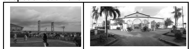
Gambar 4. Perbedaan intensitas aktivitas ruang