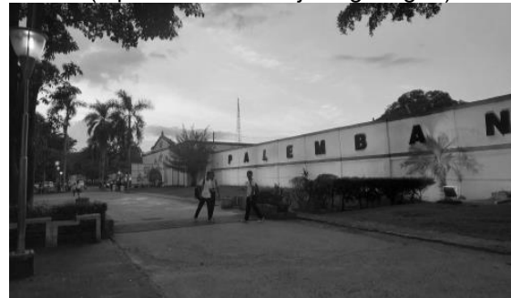
Gambar 2. Pagi Hari di kawasan BKB

Sore Hari (± pukul 15.00-Menjelang Magrib)