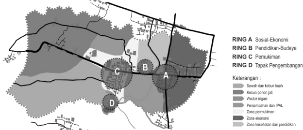
Gambar 3. Hasil Kluster Pengembangan Desa Wisata Batik Pungsari

Indikator melalui enam elemen tersebut mendapatkan hasil pemetaan eksisting kawasan Desa Pungsari yang nantinya memudahkan untuk diklusterkan sesuai dengan potensi masing-masing titik perencanaan. Identifikasi terhadap enam elemen yang telah disesuaikan dengan model penelitian terdahulu menunjukkan bahwa Desa Pungsari memiliki beberapa potensi yang tersebar dalam satu lingkup kelurahan. Potensi desa terkluster menjadi empat, yaitu Ring A sebagai kluster sosial-ekonomi, Ring B sebagai kluster pendidikan-budaya, Ring C sebagai kluster pemukiman, dan Ring D sebagai kluster pengembangan terpadu. Berkaitan dengan hasil titik eksisting keempat ring tersebut disesuaikan dengan hasil dari eksisting potensi Desa Pungsari berdasarkan variabel enam indikator standarisasi penilaian. Penekanan pada keempat ring guna memudahkan skema dan strategi perencanaan desa wisata bati terpadu. Skema ini nantinya dapat dijadikan pilot project perencanaan kawasan wisata batik di Desa Pungsari.